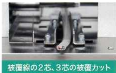
被覆線の2芯、3芯の被覆カット