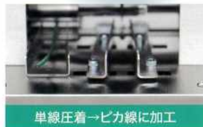
単線圧着→ピカ線に加工

スマートカッターで、被覆(皮)の付いた雑電線から被覆を取り除いたピカ線(銅線で1本の断面が1.3mm以上あるもの)にすることで買い取り価格がアップします！